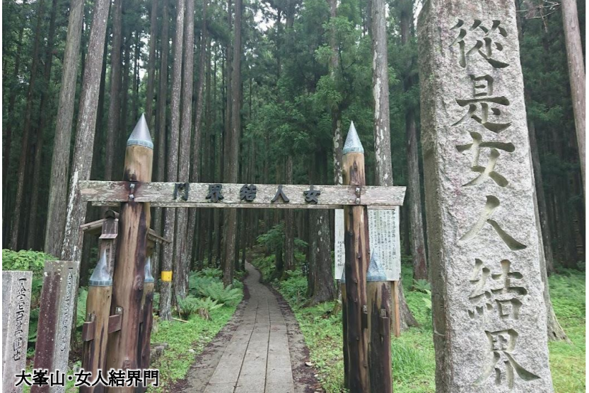
大峯山・女人禁界門

ツアーではなかなか訪れられない秘境「天川村」と「十津川村」を巡ります。標高が高いため、日本の8月の平均気温よりも1～2度程度低く過ごしやすい地域です。