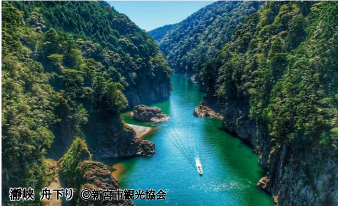
瀨峡 舟下り

古来、日本人は遥かなる峰々、豊かな森、断崖絶壁などに畏敬の念を抱き、また水を生み、生命の源と考えた山岳を神聖視し、崇めてきました。この自然崇拜と神道や仏教などが融和し、深山幽谷に分け入って修行することによって神秘的な力を得、自他の救済を目指そうとする信仰が生まれました。これが「修行して験力を顕す道」=修験道です。 修験道の開祖とされる役行者(えんのぎょうじゃ)は聖なる山野に伏して修行に励み、金剛蔵王大権現を感得しました。その山こそ、霊峰・大峯山です。大峯山は修験道の根本道場として1300年以上の歴史を刻み、今なお多くの修験者が自己を見つめ直し、魂を再生させるため、山に入ります。その登山口には「女人禁界門」がたち、現在でも女性が入ることはできません。 かつて霊山と呼ばれる多くの山には「禁界門」が存在していましたが、明治時代以降、ほぼ全ての女人禁界が解除されました。現存する「女人 禁界門」が見られるのは日本で唯一大峯山のみです。