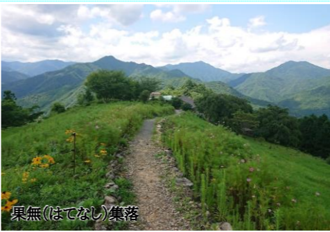
果無(はてなし)集落

～洞川温泉、十津川温泉と温泉宿にそれぞれ連泊です～ ■洞川温泉/光緑園 西清、樹源旅館 ■十津川温泉/ホテル 昴 ※上記または同等クラスとなります。※温泉宿は基本的に和室となります。また、お手洗い、お風呂は共同となる場合がございますので予めご了承ください。※洋室や簡易ベッドが追加できるホテルもございますが、その場合は追加料金がかかります。料金はお問合せ下さい。