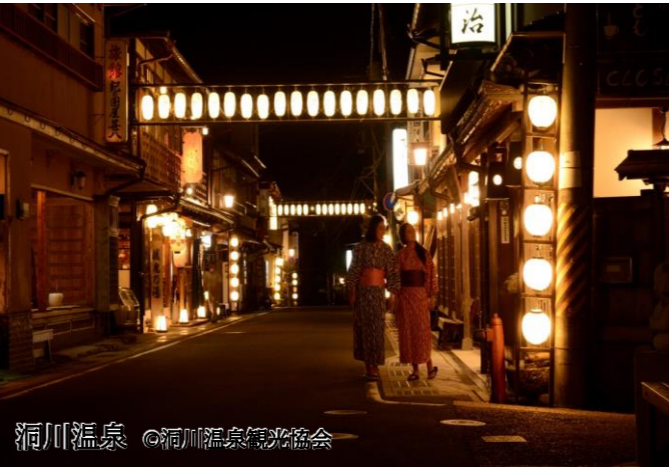
洞川温泉

三重県、和歌山県、奈良県にまたがる巨大な滝が少しずつ岩を侵食してきた大深谷「瀨峡」。当ツアーでは、三重県と奈良県の間にある和歌山県の飛び地「玉置口」から、巨岩が連なる大自然の造形、透き通る水、荘厳な山々、古より人々の暮らしに寄り添ってきた川と遥か昔から変わらない大自然を満喫する瀨峡巡り「熊野川舟下り」をお楽しみいただけます。 熊野川はかつて皇族たちが熊野本宮大社と熊野速玉大社を巡拝する際に利用したとされる川です。舟から望む布引の滝や蛇和田滝などの景色を語り部が案内してくれて、歴史や物語も一緒に知ることができます。